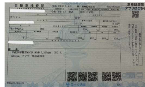
撮影例⑭：車検証の画像をお願いいたします。