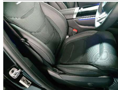
撮影例⑥：運転席シート