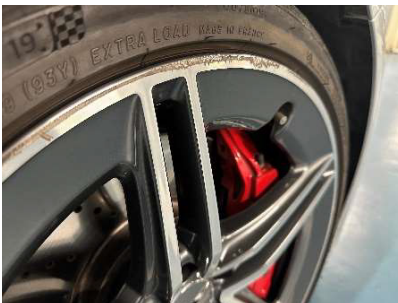
撮影例⑪：ホイールガリ傷