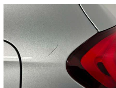
撮影例⑫：飛び石・凹み・傷など ※ボディ&バンパー