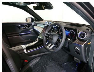
撮影例⑤：全席室内全体