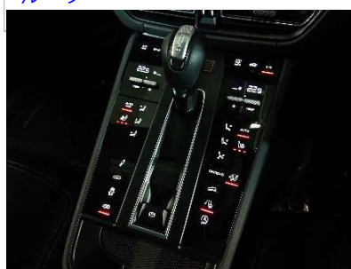
撮影例⑩：セレクトレバー周辺のスイッチ類の撮影